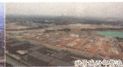
融景城西部整治后