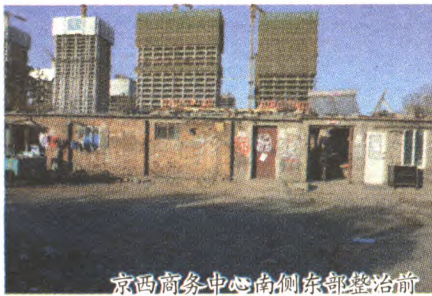
京西商务中心南侧东部整治前

整治了古城南街片区、融景城西部片区、鲁谷衙门口南片区等一批严重影响城市形象、重点工程建设、群众反映强烈和安全隐患突出的典型低端产业聚集人群大院,为实现“基本无违法建设区”目标,起到了强有力的推动作用。