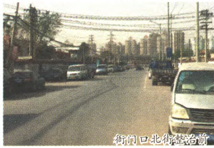
衙门口北街整治前