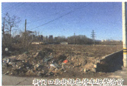
衙门口北街绿色停车场整治前