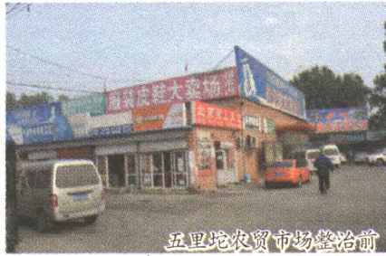
五里坨农贸市场整治前