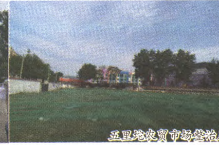
五里坨农贸市场整治后