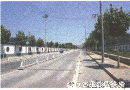
衙门口北街整治后