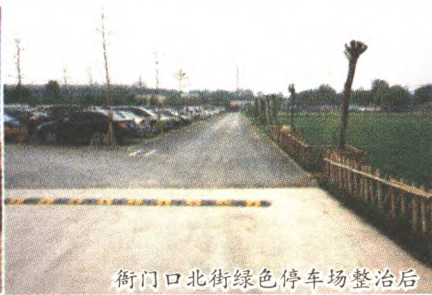
衙门口北街绿色停车场整治后