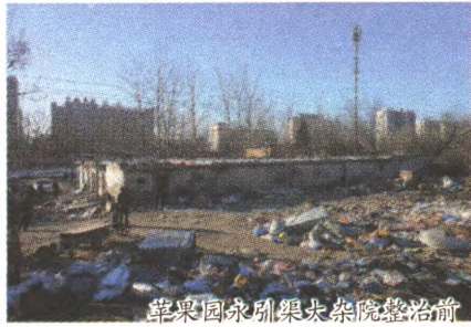
苹果园永引渠大杂院整治前