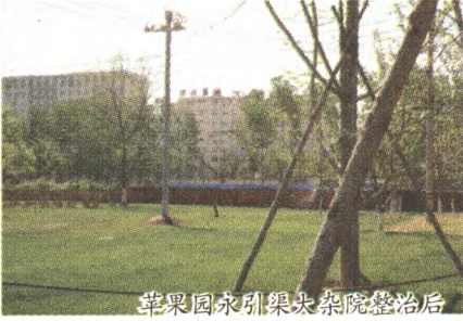
苹果园永引渠大杂院整治后