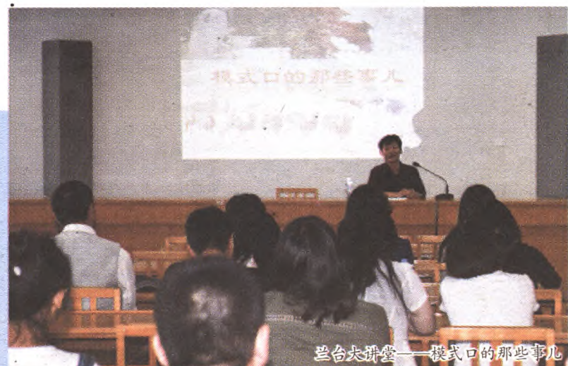
兰台荟萃——模式口的那些事儿