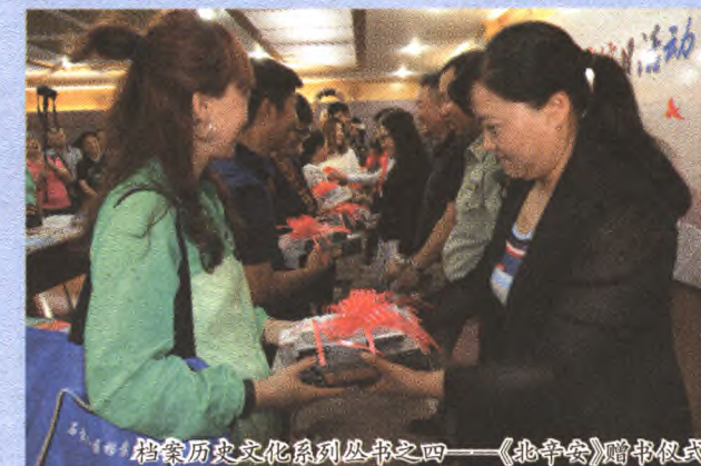
档案历史文化系列丛书之四《北辛安》赠书仪式