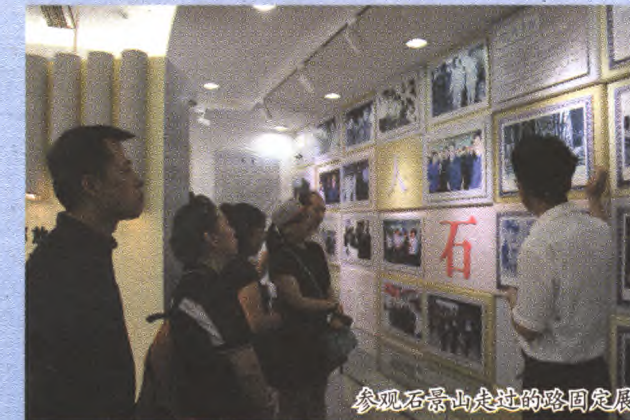
参观石景山走过的路固定展