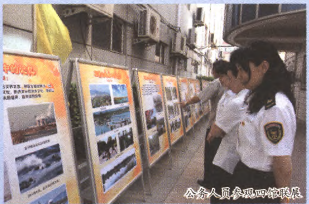
公务人员参观四馆联展