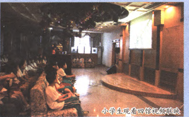
小学生观看四馆视频联展