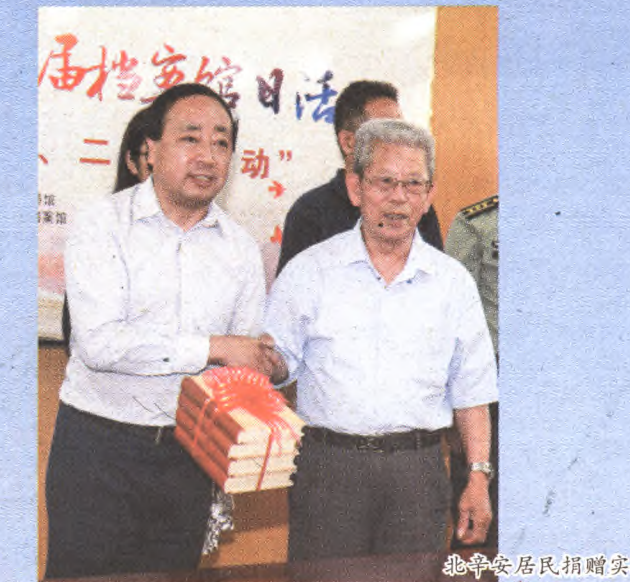
北辛安居民捐赠实物