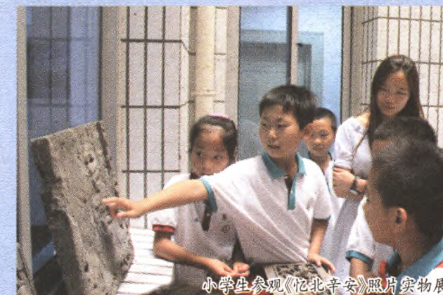
小学生参观《北辛安》照片实物展