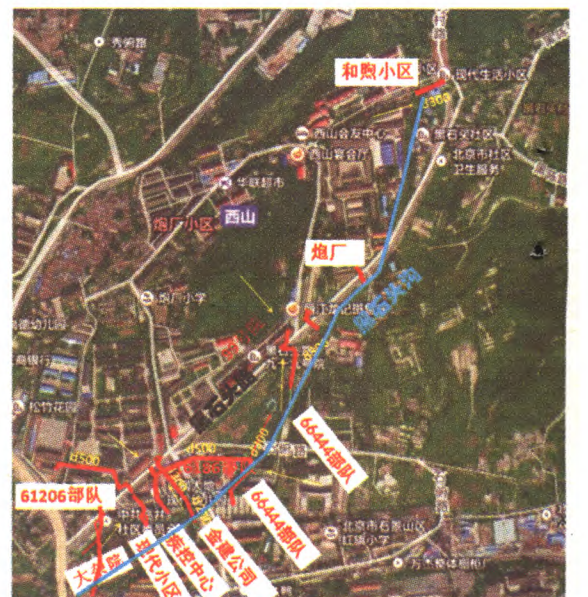
黑石头沟截污工程