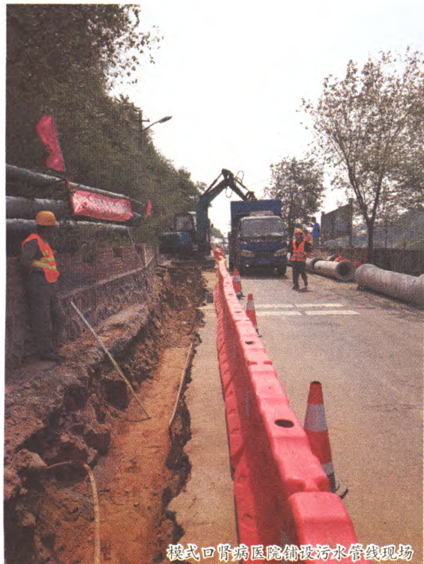
模式口肾病院铺设污水管线现场

浙沥沥的小雨,轰鸣的挖掘机声,五六个身穿橙色衣服、头戴红色安全帽的工人正在挖着遍布坚硬风化石的沟渠,路的另一边整齐摆放着一节一节的圆形管道。模式口