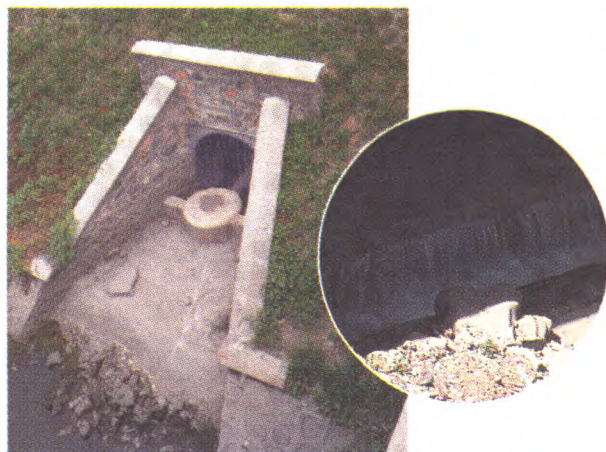
人民渠污水明排改造前后对比

动解决福田寺驻地部队的积水问题。四是协调解决南宫保障房B地块的排水问题。第二,积极解决社情民意案件。一旦接到有关排水方面的问题,区水务局立即派相关人员到现场进行核实,对情况进行分析,对乱排私接现象,制订解决方案。上半年,共处理督察通报、便民电话转办、社情民意等排水案件49起,协调解决多处排水设施维护抢修、排水改造、水体污染及非法排污问题,在采取应急抢险及治污的同时,深入实际解决百姓排水问题。