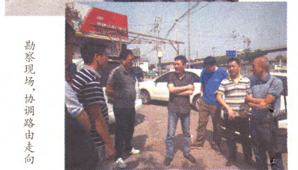
勘察现场,协调路由走向

2017年底前,石景山区将实现全区污水处理设施和管网全覆盖,为建成国家级绿色转型发展示范区提供水环境保障。