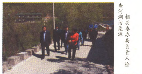
相关委办局负责人检查河湖污染源