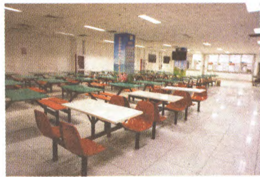
石景山医院共享食堂