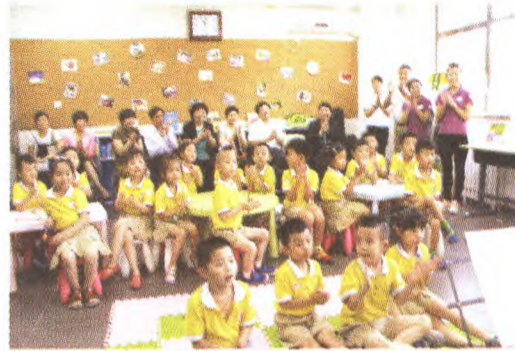
石景山区业余大学共享天光教室