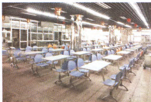
新华社第二工作区共享内部食堂