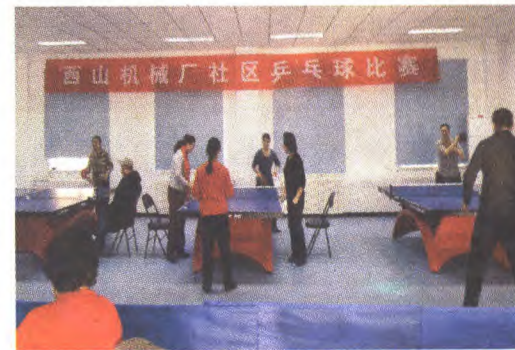
西山机械厂共享乒乓球室