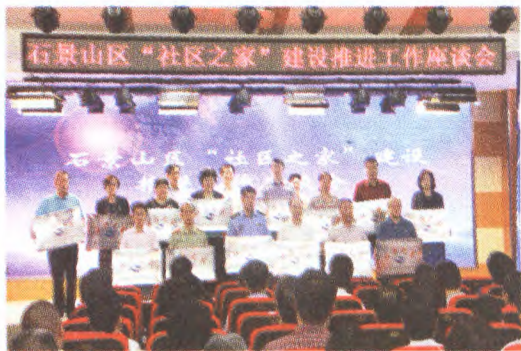
“社区之家”授牌仪式

编者按“社区之家”创建工作,以居民共同需求、迫切需求为导向,坚持“缺什么,补什么”,通过鼓励和调动驻区单位履行社会责任,开放内部设施,推动社会资源共享,促进社区服务有效供给,弥补政府公共服务不足,为社区居民提供便捷、便利的贴心服务。