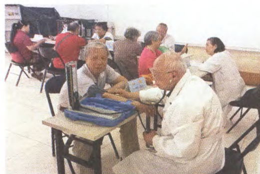
石景山医院义工社区义诊