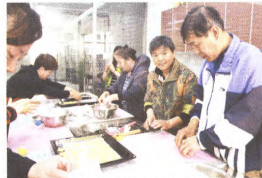
石景山区业余大学开放“西点烘焙车间”