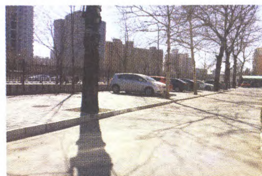
苹果园中学共享地上停车场

人民对美好生活的向往就是我们的奋斗目标,群众的“获得感”就是我们各项工作的“试金石”,如果不能给老百姓带来实实在在的利益,如果不能创造更加公平的社会环境,甚至导致更多不公平,我们的工作就将失去意义。党的十八届五中全会提出了“创新、协调、绿色、开放、共享”五大发展理念。其中,“共享”是中国特色社会主义的本质要求。全面建成小康社会还有不少“短板”要补,我们必须坚持发展为了人民、发展依靠人民、发展成果由人民共享,使全体人民在共建共享中有更多获得感,要增加公共服务供给,提高公共服务共建能力和共享水平。