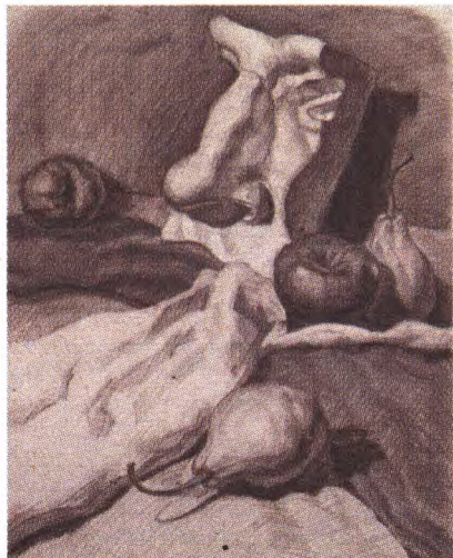
古城中学高一3班 郭胤 指导教师 刚艳