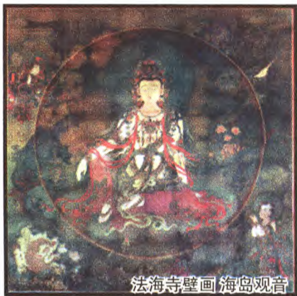
法海寺壁画 海岛观音

承恩寺,位于模式口大街北侧,坐北朝南。承恩寺东邻三界伏魔大帝庙,西为龙王庙。明司礼监太监温祥于正德五年(1510年)兴建,正德八年(1513年)竣工。2006年5月25日国务院公布为全国重点文物保护单位。