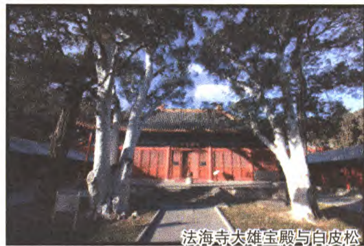
法海寺大雄宝殿与白皮松

东序上描画的皇帝站在左侧突出位置,正在虔诚地放飞1只鸚鵡,1个侍女手捧最后1只鸟准备交给皇帝放飞,画面上已经放飞的鸟有7只,可以看出将有9只鸟自由自在地飞向蔚蓝的天空。两铺壁画向人们生动地诠释了回归大