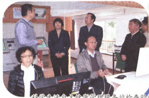
科学生活自主健康管理服务站检查验收

2016年,通过两个科普项目实施就为社区送去科普讲座50场,健康科普沙龙20场,47位市、区级科普专家走近百姓身边,各项活动直接参与居民达3400余人,受益人