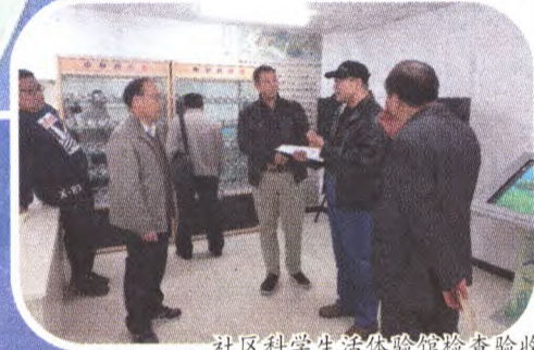
社区科学生活体验馆检查验收