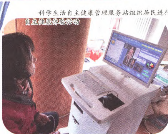
科学生活自主健康管理服务站组织居民进行自主健康体验活动

在十二五期间,区科协通过市级专项科普项目及科普益民计划项目,共争取到市财政专项资金1471万余元。这些项目截止至2017年3月全部落地实施,有效提升了我区科素工作水平。为推动石景山区科学发展,巩固我区“十二五”期间公民具备科学素质的比例达到15.8%、全市排名第五的优异成绩,共同构建高端绿色发展生态和初步建成国家级绿色转型发展示范区具有不可比拟的作用,必将为今年“疏解整治促提升”专项行动和早日实现“十三五”期间我区公民科学素养水平达到18%的目标做出重要贡献。