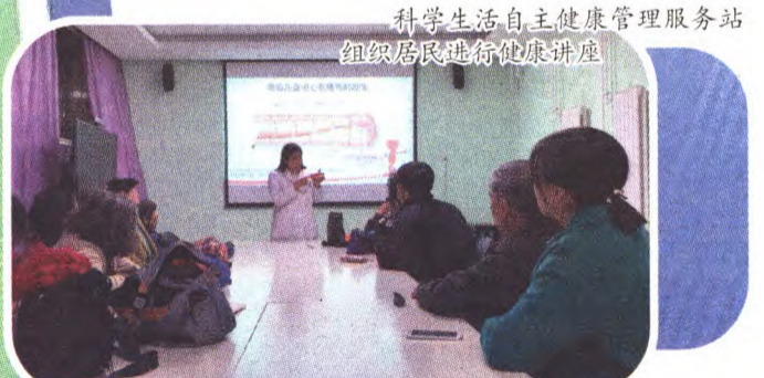
科学生活自主健康管理服务站组织居民进行健康讲座