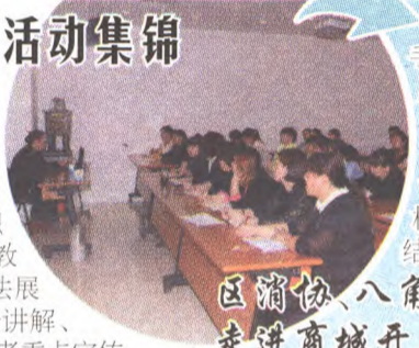
区消协、八角工商所 走进商城开展维权讲座

3月14日上午,石景山区消费者协会、工商分局合同科、鲁谷工商所与区质监局一道,在万达广场组织举办国际消费者权益日普法宣传教育活动。活动现场,通过摆放普法展板、发放宣传材料、执法人员现场讲解、接受群众咨询等方式,向广大消费者重点宣传了网络购物法规、消费维权、消费纠纷解决、防范合同欺诈等方面的知识。这次活动为群众树立理性消费理念、学习消费维权法规、提高识假防骗能力、梳理合同意识、维护自身合法权益搭建了平台。