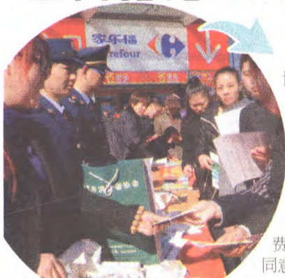
区消协、鲁谷工商所、合同科 万达广场发放维权手册千余份

3月14日上午,石景山区消费者协会、工商分局合同科、鲁谷工商所与区质监局一道,在万达广场组织举办国际消费者权益日普法宣传教育活动。活动现场,通过摆放普法展板、发放宣传材料、执法人员现场讲解、接受群众咨询等方式,向广大消费者重点宣传了网络购物法规、消费维权、消费纠纷解决、防范合同欺诈等方面的知识。这次活动为群众树立理性消费理念、学习消费维权法规、提高识假防骗能力、梳理合同意识、维护自身合法权益搭建了平台。