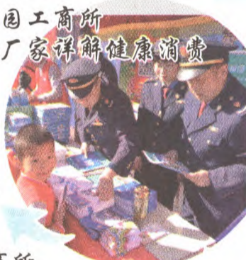
苹果园工商所 联合厂家详解健康消费

3月12日,苹果园工商所利用周末时间,在苹果园大街京客隆超市门前举行以“网络诚信 消费无忧”为主题的宣传活动。活动现场,工商所干部发放《新消法》,为百姓讲解网络消费陷阱和权益保护常识,“岳岩”矿泉水和“三元”牛奶厂家到场为消费者普及健康消费知识,“无限极”的志愿者在现场发放直销与传销区别的宣传材料。