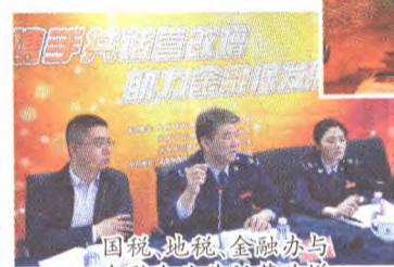
国税、地税、金融办与金融企业共话营改增