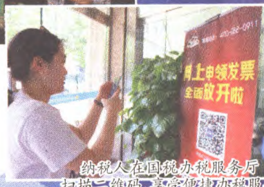
纳税人在国税办税服务厅扫描二维码,享受便捷办税服务