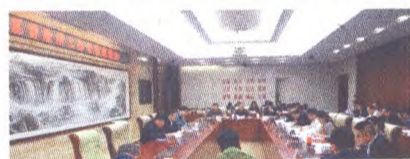
石景山区召开营改增工作推进会

营改增全面推开之后,实现了增值税对货物和服务的全覆盖,大多数行业都能受益于增加抵扣从而减少重复征税,我局与地税局先后组织到我区创业公社开展“我谈营改增”活动、金融企业共话营改增等活动,开展大走访、大调查,解释好、宣传好营改增相关政策,以问需求、优服务、促改革到重点企业等面对面宣传营改增政策,做好减税效应分析。