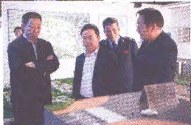
市国税局局长李亚民与区领导夏林茂等一同到石景山区保险产业园调研走访

从2012年的稳增长到2016年推进供给侧结构性改革攻坚,这五年间,围绕着服务区域经济发展,石景山国税局以组织税收收入为中心任务,不断推进落实营改增等各项税收改革,提升税收征管服务水平,认真落实和完善税收优惠政策,积极培育我区经济社会发展的新动能。