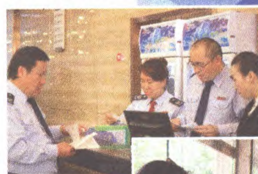
税务干部到企业解决企业开票中的实际困难

五是关注部门内生动力建设。将积极做好数字人事上线运行,发挥数字人事对干部成才的激励作用,把这种内生动力有效转化为税收事业发展的深层次力量,继续做好绩效管理工作的不断突破,努力营造绩效文化,牢牢抓住绩效管理这一提升机关工作质效的重要手段,激发队伍活力,提升税务干部队伍的整体素质。