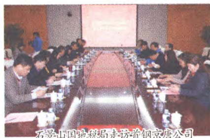
石景山国地地税局走访首钢京唐公司

有效落实中关村国家自主创新示范区“1+6”税收优惠政策为我区招商引资产业结构调整、新兴产业提供了税收政策支持。对高新技术企业、研发费用加计扣除企业、软件企业进行政策辅导。开展走访区属企业工作,了解企业生产经营情况,协调解决企业涉税难题。同时通过公开课、联席会、指导专刊、编写政策汇编等形式,宣传石景山区国家服务业综合改革试点区优势产业。认真梳理税收优惠政策,提炼重点内容,编写税收优惠政策手册,利用微信公众平台等新平台,将政策及时送到纳税人手中。积极落实《企业所得税优惠政策事项办理办法》,简化优惠备案程序,努力让创新创业企业第一时间享受税收优惠政策。2012~2016年,石景山地税局有效落实税收优惠政策,共计减免税款近30亿元,使辖区企业进一步享受政策红利。