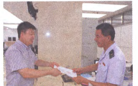
石景山地税局为冬奥会奥组委办理了税务登记信息录入手续,正式成为入驻石景山区的纳税单位。