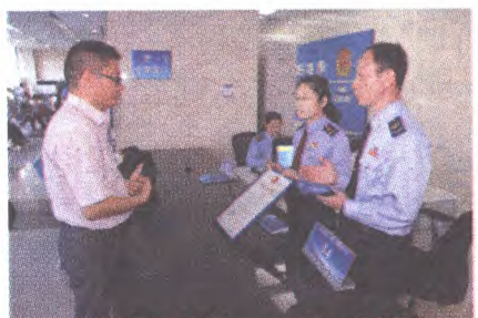
全市首张“三证合一、一照一号”营业执照颁发,工商和税务干部为纳税人解答问题。

2015年5月20日,北京嘉利新宏科技有限公司负责人从程红副市长手中接过全市首张“三证合一、一照一号”营业执照,该企业一网通报,工商、质监、税务并联预审,简化的流程,翔实的信息,首张“一照一号”营业执照的颁发,标志着石景山区在全市率先开展商事主体登记“三证合一、一照一号”试点。