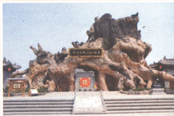
大槐树寻根祭祖园