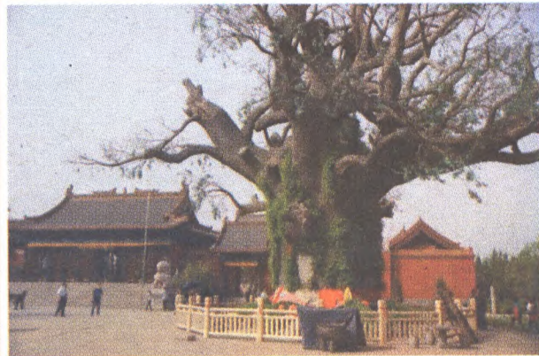
山西洪洞县大槐树

识别山西省洪洞县大槐树移民的后裔，据传有以下两个特点：其一，官兵为防止移民逃跑，迁徙时把他们的双臂反绑起来，由于长时间捆绑，双臂麻木，习惯成自然，所以山西省洪洞县大槐树移民的后裔都习惯背着手走路；其二，移民在押解过程中双臂反绑，假如要小便，只好央求官兵：“官爷，请把我的手解开，我要小便。”因此，山西省洪洞县大槐树移民的后裔把小便称为“解手。”