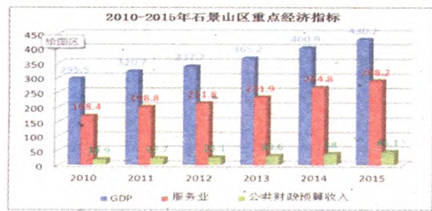
图“十二五”时期石景山区重点经济指标

“十二五”期间,石景山服务业年均增长11.3%,高出GDP年均增速3.5个百分点。2015年,地区生产总值完成430.2亿元,服务业增加值实现288.2亿元,占GDP比重67%,较2010年提高了10个百分点。2015年,试点区公共财政预算收入45.1亿元,服务业实现入区税收38.9亿元,占一般公共预算收入的86.3%,成为推动区级税收增长的主力军。服务业不仅解决了首钢搬迁留下的产业空心化问题,而且有效弥补了其所带来的经济缺口,服务业成为推动地区经济发展的重要引擎。