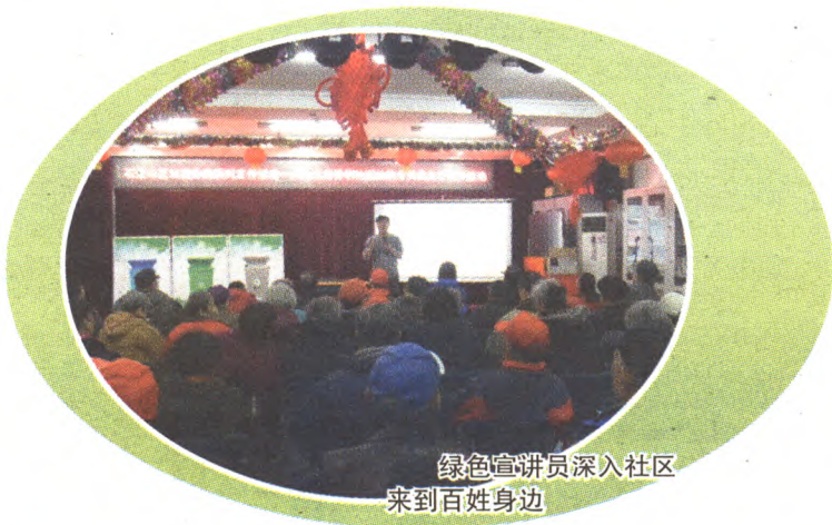
绿色宣讲员深入社区来到百姓身边

组织居民参观生活垃圾处理设施。经市城管委协调安排,我区多次组织各街道居民代表及绿色宣讲员参观鲁家山垃圾焚烧厂、高安屯循环经济产业园等垃圾处理设施。提高了辖区居民面对“垃圾围城”的危机意识,通过深入了解垃圾的分类处理方式,各种资源的回收利用价值,培养居民养成垃圾减量、垃圾分类的生活习惯。