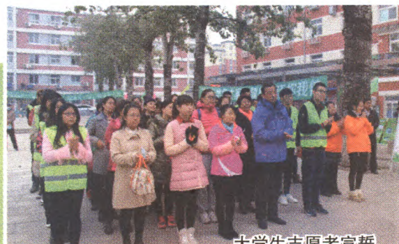
大学生志愿者宣誓

2016年是全市垃圾分类运行管理工作的巩固与提升之年,我区按照市级统一部署和要求,以提升我区生活垃圾减量、分类效果为目标,通过在分类达标小区中推行企业化运行模式,聘请第三方机构监督评价运行成效,引入专业的分类宣传培训队伍等方式,在厨余垃圾分出量、居民知晓率及参与度、运行管理水平等方面得到了全面提升和加强。