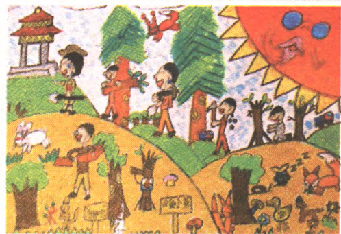
和谐 二年级(1)班 王一帆