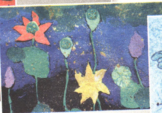
出淤泥而不染 一年级(2)班 徐然歆