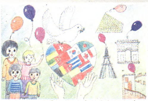
世界和平 二年级(1)班 赵紫翔