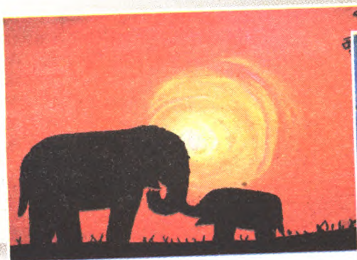
母子情 一年级(3)班 甄李