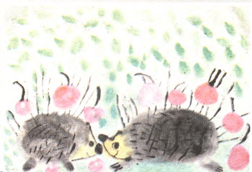
两只刺猬 一年级(1)班 易子涵