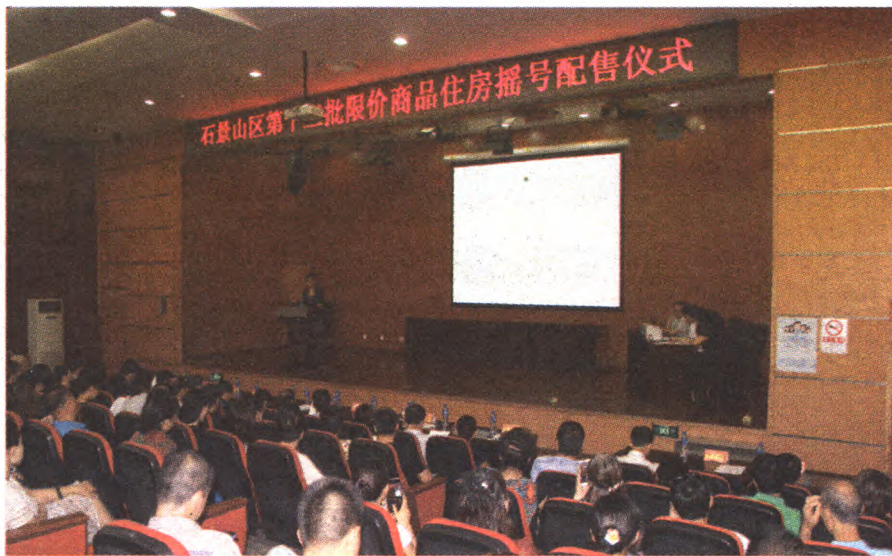
第十二批限价房摇号配售仪式

按照保障房相关政策,对于每年领取廉租房、公租房、市场租房补贴家庭,入住实物配租房家庭及承租公租房家庭的家庭人口结构、收入、住房、资产、房屋实际居住情况等进行定期复核,同时根据群众的举报进行及时核查,对于不符合条件或违规使用家庭及时按照政策进行清退。今年9月23日我区进行了第四批公共租赁住房摇号配租,共计摇出了418户家庭的选房顺序号,目前老古城公租房项目已全部选房完毕,对于未选到房源的家庭根据廉租实物住房、公共租赁住房项目承租家庭清退房源情况,按照摇号结果递补选房,确保房源滚动使用。