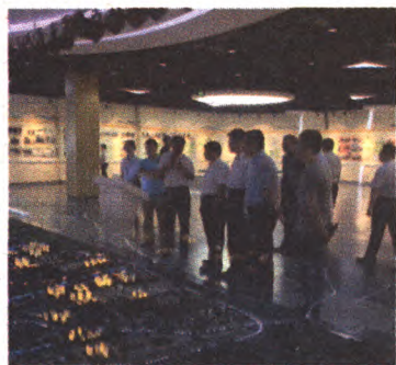
市住保办领导视察燕保京家园公租房项目

石景山区是北京市传统老旧工业区,当前正处于深度转型期,尤其是随着首钢涉钢产业的搬迁,企业富余分流人员进一步增加,其中中低收入家庭数量较多。在我区14万户籍家庭中,保障性住房申请量达到3.5万余户,申请比例高达21.78%,为全市最