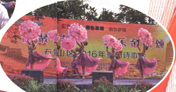
2016年重阳诗歌会 舞蹈《花开盛世》