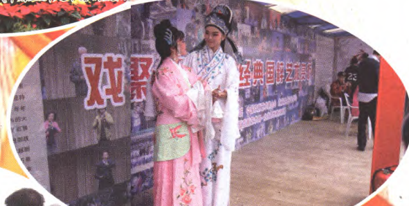
戏聚石景山演出现场