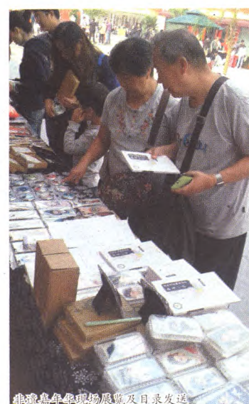
非遗嘉年华现场展览及目录发送