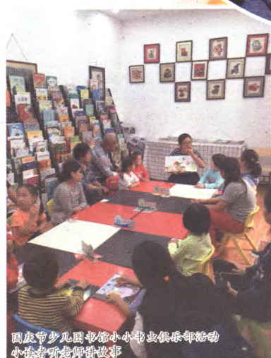
国庆节少儿图书馆小小书虫俱乐部活动 小朋友们听老师讲故事