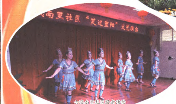
古城南里社区敬老活动