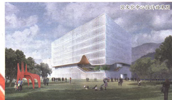
区文化中心设计效果图