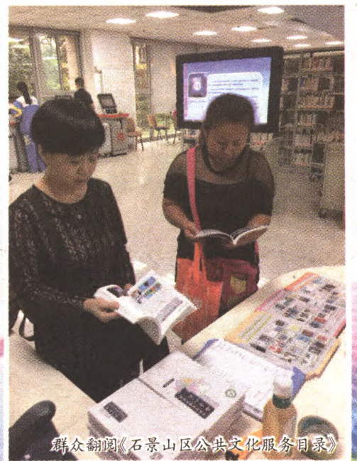
群众翻阅《石景山区公共文化服务目录》