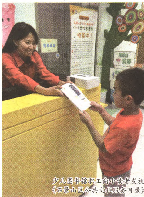
少儿图书馆职工向小读者发放《石景山区公共文化服务目录》