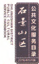
《石景山区公共文化服务目录》封面

在编印发放《目录》纸质文本的同时,我区正在开发建设石景山区公共文化服务数字化平台。通过互联网实现公共文化服务咨询查询、在线点播、在线培训、报名参与和评价反馈功能。届时,群众可通过互联网、手机APP等多种形式获取最新公共文化服务目录信息,足不出户在线观赏文艺演出、聆听名家讲坛、参加教育培训,高效、便捷地享受高端普惠的文化成果。