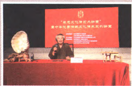
中国工艺美术玉雕大师、高级工艺美术师李博生“玉——大地之舍利”专题讲座

秉承“传承发展,特色创新,开放融合,博采天下”的文化理念,燕京八绝京绣技艺、花丝镶嵌技艺、金漆镶嵌彩绘雕填工艺、红木的分类与鉴定等知识讲座、展览展示活动将持续相继展开,越来越多的传统技艺将在石景山区大放异彩。