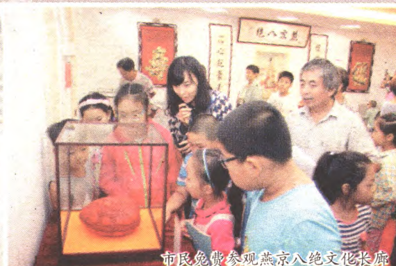
市民免费参观燕京八绝文化长廊