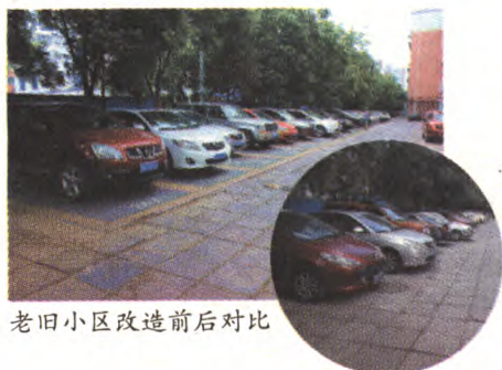
老旧小区改造前后对比