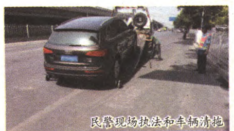
民警现场执法和车辆清拖