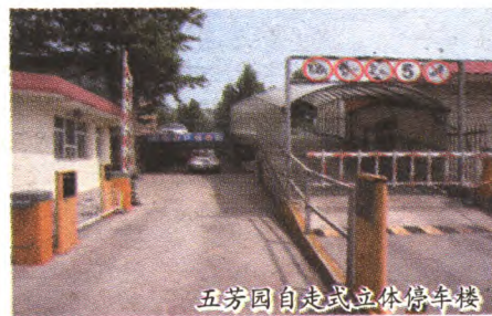
五芳园自走式立体停车楼