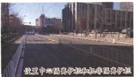
设置中心隔离护栏和机非隔离护栏