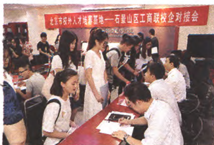
本报讯(通讯员肖秋兰 李孟琦)7月5日,“北京市校外人才培养基地——石景山区工商联校企对接会”在北方工业大

学第二教学楼会议室举行。首特孵化器、华海孵化器等9家工商联会员企业为学子们提供了60多个实习岗位,北方工业大学经管学院的80多名学生与企业代表进行了现场交流,现场达成实习意向47人次。