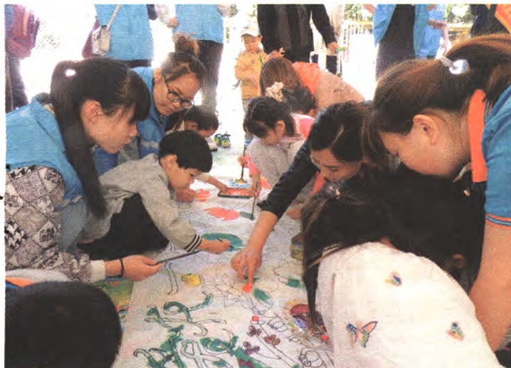
志愿者和残障儿童共同创作《爱在一起》美丽图画

残疾儿童因其生理、心理等方面的缺陷,成为残疾人中需要特别关爱和特殊照顾的弱势群体。近年来,石景山区委、区政府高度重视残疾儿童的抚育、教育和培养工作,儿童福利院的老师像爸爸、妈妈一样精心呵护他们,社会各界、志愿者群体奉献爱心,使他们像健全儿童一样茁壮成长。