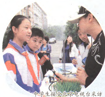
中学生接受北京电视台采访

管他农业命脉,工业血液还是生命源泉 若,有人将你辜负 请你把他流放 倘若有人将你辜负 请你把他流放! 流放!