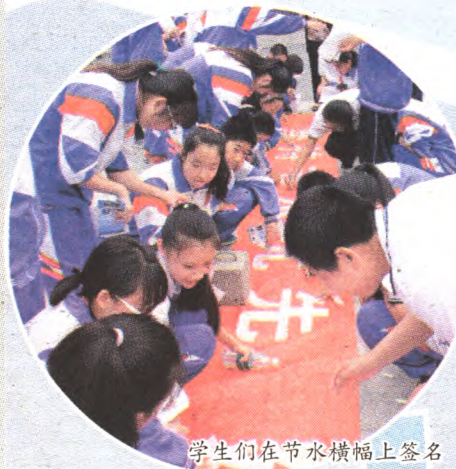
学生们在节水横幅上签名