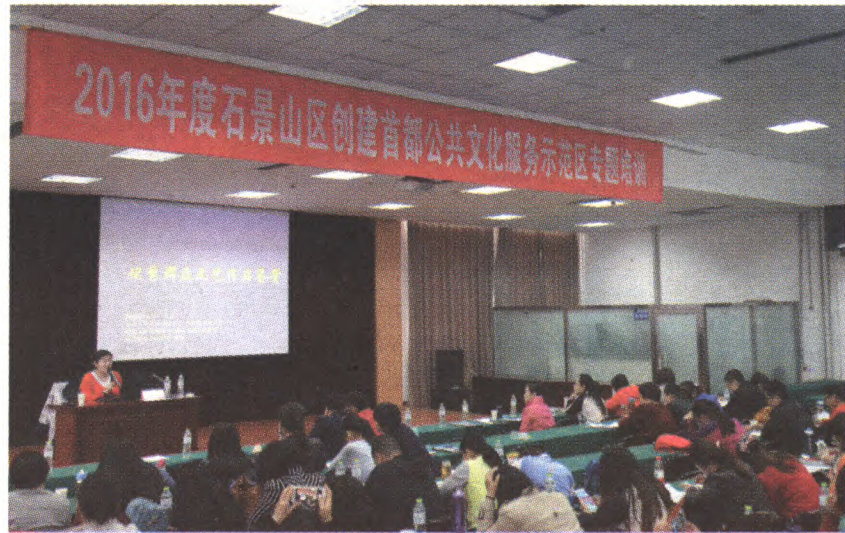
我区举办创建首都公共文化服务示范区专题培训

做好首都公共文化服务示范区创建工作的宣传和动员,综合运用电视、报刊杂志、网站等多种渠道,加大对创建工作的宣传力度,定期在各级新闻媒体上展示最新创建成果。通过培训和专题会议等多种形式,对系列政策文件进行宣讲和解读,形成全社会关心创建、参与创建和监督创建的良好氛围。