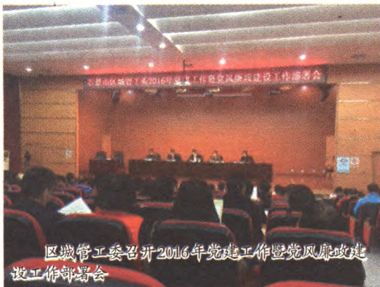
区城管工委召开2016年党建工作暨党风廉政建设工作部署会

城管工委以“两学一做”为主线,推动学习教育从“关键少数”向全体党员拓展、从集中性教育活动向经常性教育延伸。一是强化“学”的自觉性,涵养思想,修养党性。把“两学一做”作为党员干部打牢思想根基的“营养源”和必修课,力求学深学透、内化于心。以党章、党内政治生活若干准则、中国共产党廉洁自律准则、纪律处分条例为重点,引导广大党员守住为人做事的基准和底线;以习近平总书记系列重要讲话为重点,深入领会贯穿其中的马克思主义立场观点方法,引导广大党员坚定道路自信、理论自信、制度自信。二是抓日常严经常,形成制度,养成习惯。把“两学一做”作为党员干部进行灵魂保健的自觉行动,力求落细落小,固化于制。工委借鉴成人高等教育学分、学时制的经验,着手研究制定党员干部理论学习考评办法,细化量化考评标准,拟将考评结果纳入干部实绩档案,让理论学习这个“软指标”硬起来。三是注重学以致用,工学互补,推动实践。把“两学一做”作为党员干部增长本领、提升能力的有效途径,力求边学边干、转化于果。一方面统筹安排日常工作计划与教育学习计划,坚持把个人自学和集体学习进行有机结合,合理处理工学矛盾,避免在时间上产生冲突;另一方面引导广大党员“带着问题学、针对问题改”,通过理论学习促进思想观念的转变,通过转变思想观念提升破解现实难题的能力,通过实践检验理论学习的成果。