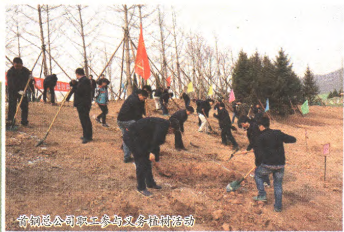
首钢总公司职工参与义务植树活动