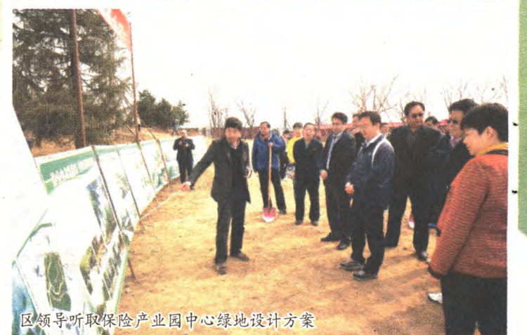
区领导听取保险产业园中心绿地设计方案

4月的北京,春回大地,万物复苏,正是挥锹铲土植树造林的大好时节。4月6日,石景山区绿化委员会办公室以全民义务植树运动开展35周年为契机,在保险产业园中心代征绿地组织主题为“融合山水谋发展 建设首都西大门”的植树活动,这也是我区连续第35年组织大型义务植树劳动。驻区部队官兵、机关、企事业单位干部职工、劳模、妇女代表及大中小学生等12个单位500余人参加了义务植树劳动。参加劳动的同志们热情高涨,整个活动共平整土地10000平方米,栽植银杏、元宝枫、七叶树、法桐、雪松、新疆杨等树木300余株。区领导、驻区部队首长、中国保险学会及首钢总公司等领导一同参加了植树活动。本次植树活动进一步增强了市民参与绿化建设、保护绿化成果的意识,掀起了我区春季绿化美化和植树造林的新高潮。