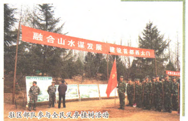
驻区部队参与全民义务植树活动