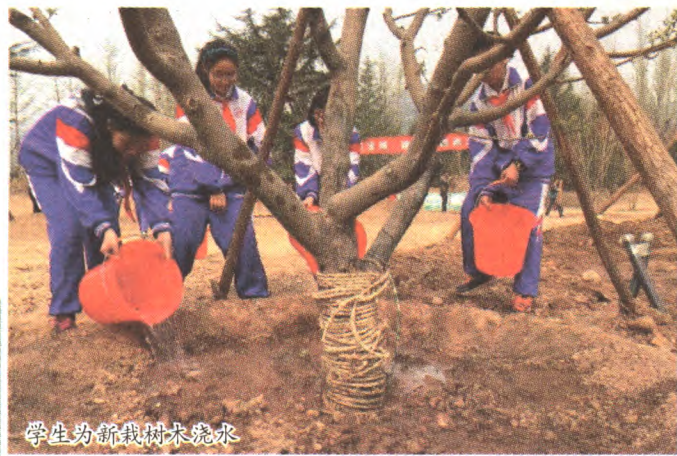
学生为新栽树木浇水