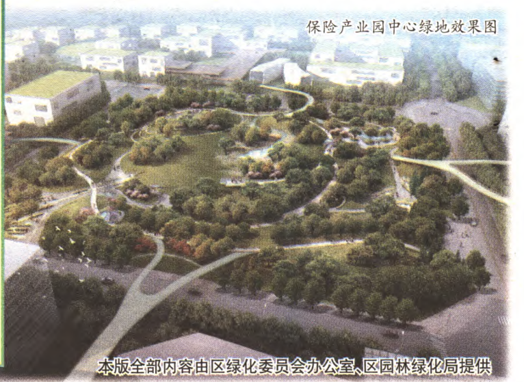
保险产业园中心绿地效果图

保险产业园中心绿地是本次义务植树活动所在地,面积3.65公顷。绿地以自然中的风、光、云、木、水、石为设计元素,融入“海绵城市”理念,通过高低起伏的地形,山坡以林木覆盖,山谷内种植芳香植物,洼地在雨季形成雨水湿地花园涵养地下水。芳香谷、彩虹日晷亭、人工溪流、云墙、栈道、挑台、创意广场等为使用者提供了丰富的观景方式和游园乐趣。这里将不仅是一处生态景观,还能为产品行销、展示、发布提供空间,成为产业延伸的绿色平台。