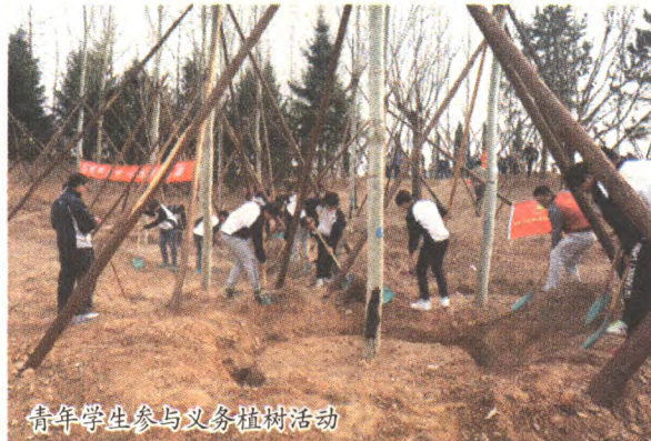
青年学生参与义务植树活动