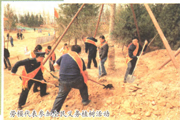
劳模代表参加全民义务植树活动