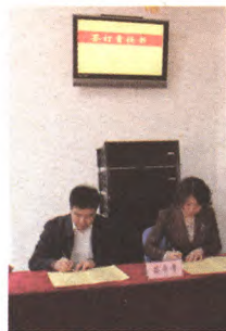
街道主要领导签订廉政责任书

以载体创新激发党建活力,助推社会主义核心价值观传承。实施“党建项目化超市”,建立项目认领机制和互动服务机制;党工委牵头主办了北京市首家“爱八角”曲艺茶园,组织公益活动12次,既展示了传统文化魅力,又寓教于乐传播正能量,助推了社会主义核心价值观的传承。以文化活动策划彰显党建魅力,高端文化大餐更加亲民。与北京演艺集团等专业机构合作,实施“百姓乐享”服务项目,为社区居民提供“定制式”的高水平文艺演出和专业化文化培训服务。目前,提供专业文艺演出12场、培训文体队伍175次、举办名师讲坛43讲。以志愿服务传递党建价值、品牌项目发挥正能量。在2个社区开展“一呼百应”党员综合服务平台试点,建立志愿服务队,开展线上预约线下服务;组建“非公楼宇公益星志愿服务联盟”,着力培育“金色亲情”“应急担架”“红色1+1扶老助残”等一批党员志愿服务品牌项目。以破解难题检验党建成效,居家养老服务触手可及。党工委将辖区居家养老工作定位为“最现实的民生问题”,积极谋划并全力推进,创建了“老街坊”品牌和“110”模式,筹建并运营了街道级养老照料中心、实体化运营4个社区级居家养老服务站,形成了以居家生活为基础、以医疗康复为支撑、以贴心服务为保障的具有八角特色的居家养老服务体系。