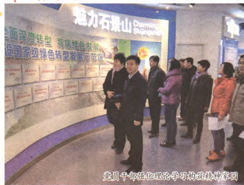
党员干部理论学习构筑精神家园

《机关干部百分制目标考核办法》,选拔任用6名科级干部;牵头街道信访代理工作领导小组,成立综合执法党总支,落实“八个高端体系”建设目标,制订街道“双支撑”发展战略,组建“治乱疏解建高端”分指挥部临时党支部,推进重大任务落实。严抓作风建设,营造风清气正的良好政治生态。建立党风廉政建设“两个责任清单”,签订“个性化”责任书233份,开展专项整治;学习宣传贯彻《中国共产党廉洁自律准则》和《中国共产党纪律处分条例》,坚持“五分钟廉政预警播报”制度;巩固群众路线教育实践活动成果,24项整改任务基本完成;从严从实开展“三严三实”专题教育,营造风清气正的良好政治生态。