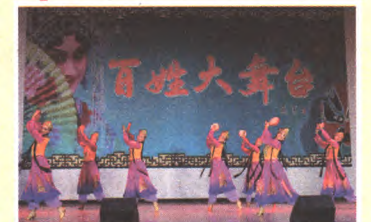
社区居民原创节目亮相百姓大舞台