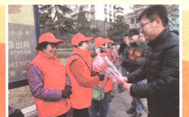
街道领导慰问志愿服务巡逻队员