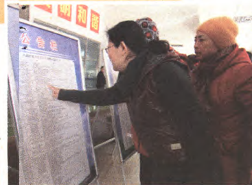
百姓监督员关注党建统领服务群众项目公示