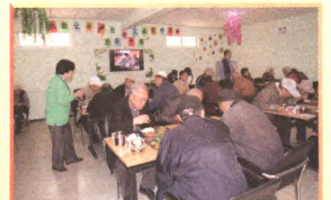
社区级养老服务为八角老人带来福音

组织生活路线图 ——为全面落实从严治党要求,强化基层党组织政治属性,在区委组织部的悉心指导下,党工委充分调研,拟在基层党组织中实施“组织生活路线图”项目,进一步细化民主生活、“三会一课”、民主评议党员等制度,严格组织生活,强化基层党组织建设。