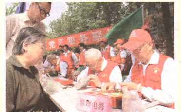
“金色亲情”服务队为居民提供志愿服务

整合组织资源,搭建街道层面的区域化党建协调议事平台;整合社会资源,完善区域化党建共建运行模式;整合党员资源,凝聚党员群众参与社会治理的合力。