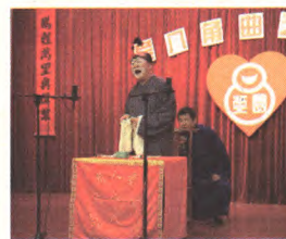
北京市首家“曲艺茶园”开进社区

层党建考核,项目实施效果接受党员群众民主评议。落实基层党组织的硬件保障。按照“八有”的标准,实现党建阵地、组织与功用“三个同步”加强。坚持党群一体化,实现小微企业工资集体协商履约率100%,地区青年汇服务实现全覆盖;建成全区首家“好帮手”社会组织公益家园,在4座楼宇设立“法律服务工作站”,开展公益法律讲座11场次;打造开放式“崇廉苑”廉政文化主题公园,使党员群众在参与、体验中接受廉政文化教育。