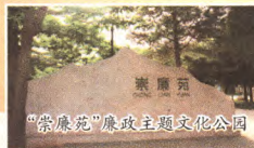
“崇廉苑”廉政主题公园