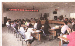
两级协商议事委员会成员集体商议