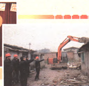
全力推进辖区“治乱疏解建高端”工作