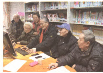
红色短信创作班成员讨论短信修改