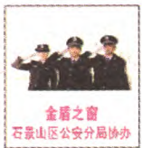
金盾之耀 石景山区公安分局协办

为确保全区社会面秩序平稳,按照市局工作要求,分局进一步提高了防控等级,由巡警支队牵头,在街面增派了巡逻警力,针对万达广场、八大处公园、石景山游乐园、地铁、公交站台等繁华场所和重点部位加大了巡控力度;由刑侦支队牵头,紧盯节日期间易发多发、群众反映强烈的“两抢一盗”、拎包扒窃等多发性侵财案件,综合运用多种手段加大打击力度;由人口部门牵头,组织社区民警、驻区民警深入社区开展宣传,进一步提高节日期间居民的安全防范意识,并积极动员群防群治力量,共同做好社区的治安防范工作。