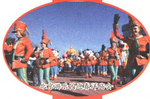
北京游乐园迎春洋庙会