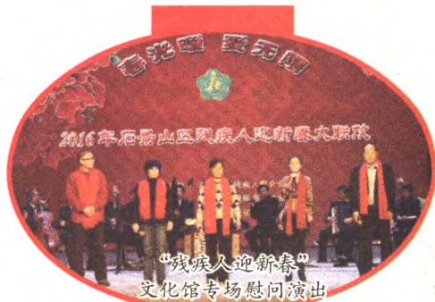
“残疾人迎新春”文化馆专场慰问演出

除此之外,春节期间还有文化馆“正月十五唱大戏”、鲁谷书画灯谜花会走街、金顶街“正月十五花会表演”、八角传统花会展示等精彩活动。