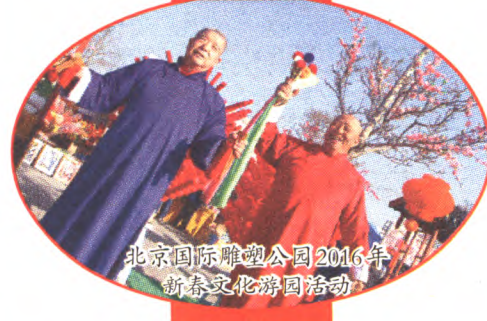
北京国际雕塑公园2016年新春文化游园活动