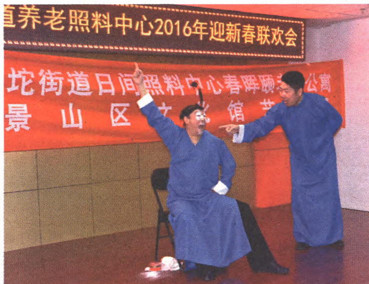
“温馨送祝福,文化进敬老院”文化馆专场慰问演出