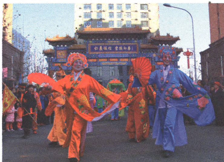
古城街道老城西社区大年初二组织“秉心圣会踩街”活动