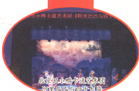
北京丑小鸭卡通艺术团《阿里巴巴与四十大盗》