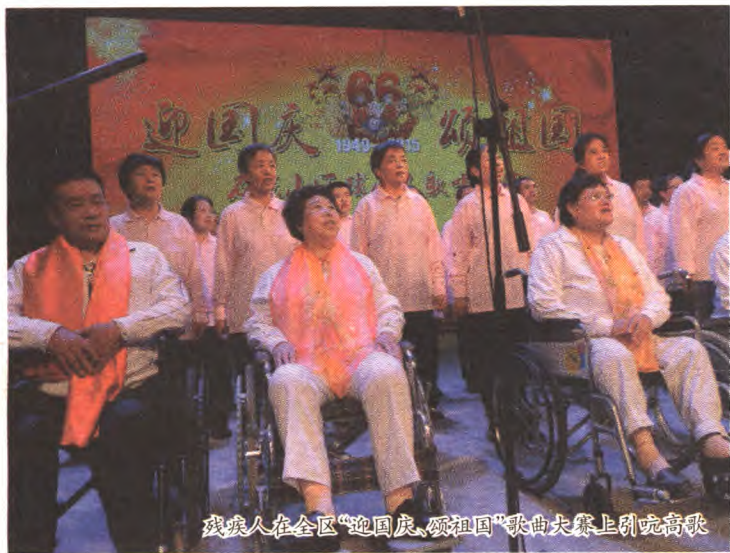
残疾人在全区“迎国庆、颂祖国”歌曲大赛上引吭高歌

回眸“十二五”期间我区残疾人事业的发展,残疾人切身感受到了春天般的温暖和温馨。党和政府在满足残疾人幸福美好新生活新期待上补短板、出实招,在就业、康复、文体等工作上谋创新、促发展,不断推进残疾人小康生活进程,基本实现了残疾人“就业有保障,康复有条件、在家有照料、出行无障碍”的工作目标。