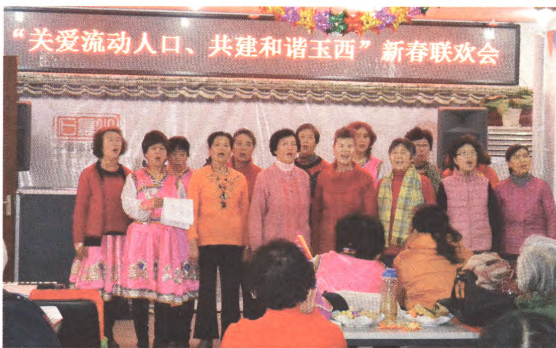
▲1月21日,老山街道计生协在玉泉西路社区组织协会会员和流动人口共同举办以“关爱流动人口,构建和谐玉西”为主题的庆新春联欢活动。在欢歌笑语中,流动人口充分感受到社区大家庭的和谐、温暖。张芳

考核组对我区2015年卫生监督工作给予充分肯定,并对2016年工作提出三点要求,一是要继续发扬好的经验做法,再接再厉;二是加强联动机制,有效开展工作;三是经常性监督和重点工作相结合,以点带面,加强传染病防控,做好打击非法行医、计划生育及控烟等工作。