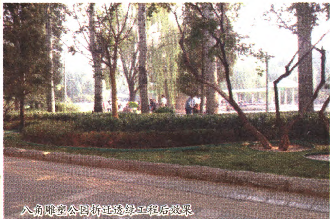
八角雕塑公园拆迁透绿工程后效果

为最大程度地保证公园开放、透明,方便市民欣赏绿化景观,促进公园景观与城市景观更好融合,2015年,石景山区公园管理中心按照区委区政府要求,充分吸纳市政协有关实施石景山雕塑公园、古城公园“拆墙透绿”试点工程的建议,本着安全、便利、实用、美观的原则,对公园景观环境、基础设施、服务设施进行了全面升级。继石景山雕塑公园改造竣工后,古城公园经过100天闭园施工改造,已基本竣工并于1月1日开放试运行。