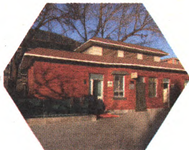
卫生间修建前后对比