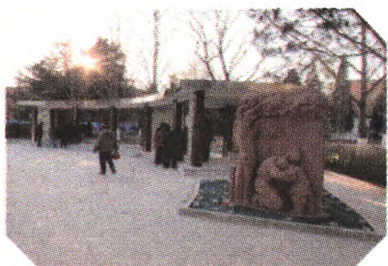
中心区回廊修建前后对比