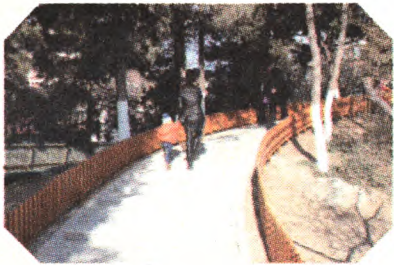
假山园路修建前后对比