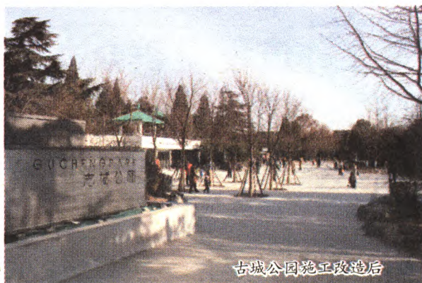
古城公园施工改造后

为最大程度地保证公园开放、透明,方便市民欣赏绿化景观,促进公园景观与城市景观更好融合,2015年,石景山区公园管理中心按照区委区政府要求,充分吸纳市政协有关实施石景山雕塑公园、古城公园“拆墙透绿”试点工程的建议,本着安全、便利、实用、美观的原则,对公园景观环境、基础设施、服务设施进行了全面升级。继石景山雕塑公园改造竣工后,古城公园经过100天闭园施工改造,已基本竣工并于1月1日开放试运行。