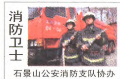
消防卫士 石景山公安消防支队协办

会议指出,当前执法环境日益严峻,消防执法规范化建设水平与法治中国建设及人民群众的期待还有较大差距,特别是当前已经进入冬春火灾防控的重点时期,大杂院专项整治难度大、影响广,全体官兵要积极主动学习业务理论知识,加快提升执法业务水平,扎实推进社会面火灾防控工作以及执法规范化建设。下一步,区消防支队将继续落实执法培训制度,进一步加大执法业务培训力度,切实增强全体执法人员的业务水平,为社会面火灾防控以及执法规范化建设奠定坚实的基础。