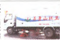
石景山区环卫中心协办