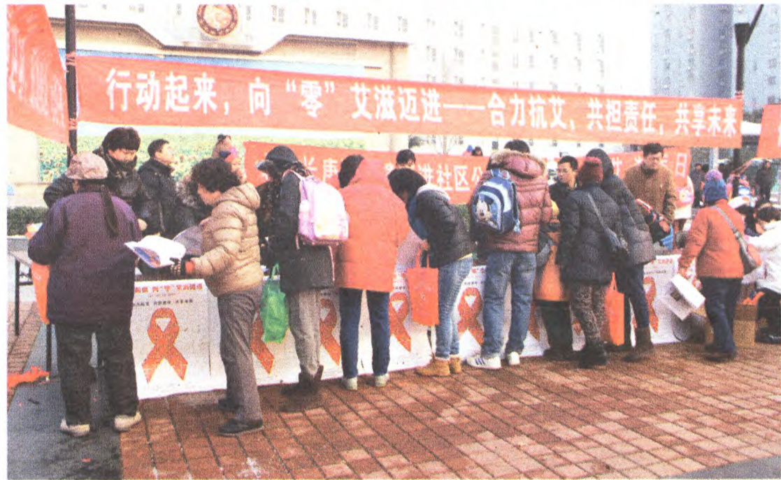
在第28个艾滋病日到来之际,区卫生计生委与疾控中心、苹果园街道、长庚医院在海特广场联合举办主题为“行动起来,向‘零’艾滋迈进”——“合力抗艾,共担责任,共享未来”的宣传服务活动。活动现场共悬挂标语条幅4条,设立宣传知识展板6块,发放卫生计生健康知识和预防艾滋病宣传品500余份、宣传册1000余份,共有100多名群众参加义诊和咨询服务。

今后,区卫生计生委将按照区纪委的有关要求,把“任前廉政考试”作为科级领导干部提拔任用的必经程序,并把考试成绩作为是否任命的重要依据。通过组织开展廉政法规考试,进一步加强新任科级领导干部廉洁自律意识,增强学习廉政法规自觉性,对促进廉洁从政、依法从政、提高拒腐防变能力起到积极推动作用。