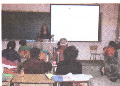
本报讯(通讯员王寅冬)为喜迎北京冬奥会,进一步营造良好的学外语、讲外语的社会氛围,扎实推进国际

语言环境建设工作,我区启动以“迎冬奥、讲外语、展风采”为主题的石景山区喜迎冬奥会市民讲外语系列活动以来,开展了“新起点”市民公益英语大课堂培训,全区9个街道(鲁谷社区)的30余名英语骨干学员参加了培训。社区学院针对居民需求和学员特点精心备课,设计了单词朗诵、诗歌赏析、对话演练、走进冬奥等教学环节,重点突出冬奥会相关知识的介绍,学员们积极发言,热情参与,课堂气氛非常活跃。“新起点”市民公益英语大课堂培训已经成功举办了十期,培养了