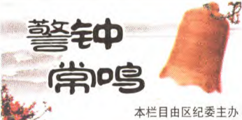
本栏目由区纪委主办

本报讯(通讯员路鹏)11月18日,由北京市文联、北京曲艺家协会主办,石景山区文联、鲁谷社区协办的“暖冬季、笑在京西——首都文艺家社会主义核心价值观主题巡演”走进鲁谷社区,百姓在家门口欣赏了一台精彩的文艺盛宴。李金斗、王文林、陈印泉、侯振鹏等著名艺术家,运用相声、快板、单弦、小品、双簧等大众喜闻乐见的艺术形式,宣传最美故事、赞颂最美精神。