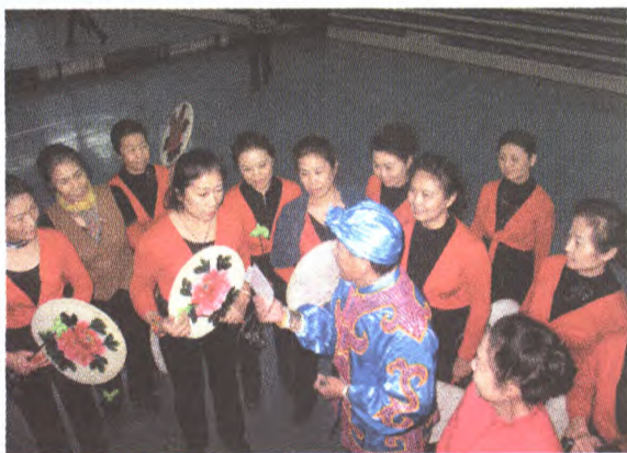
太平鼓传承人为基层舞蹈团队培训