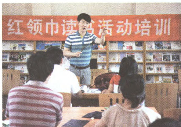
少儿图书馆红领巾读书活动培训

下一步,区委将依据重点创建任务,进一步完善创建实施方案、示范区(项目)建设的组织领导、资源整合、服务实施、政策出台、绩效评价等运行机制。努力