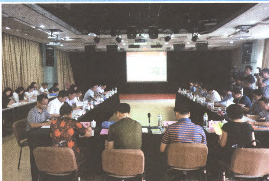
区人大调研我区公共文化服务目录制创建工作

2015年6月,市文化局、财政局联合下发关于“十三五”期间创建首都公共文化服务体系示范区的通知,我区积极响应,