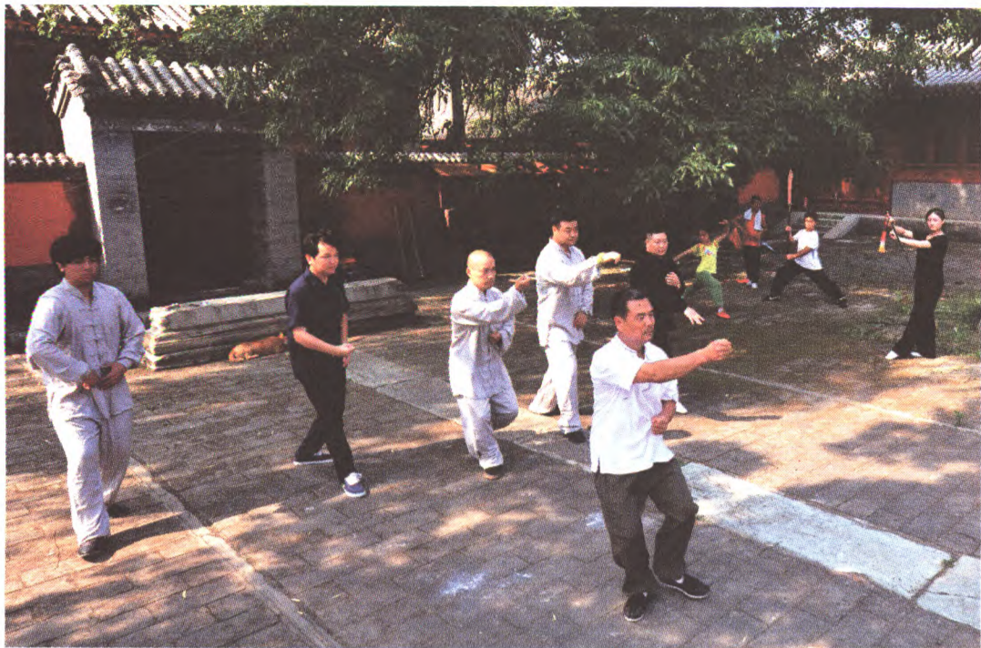
与武侠小说中师徒朝夕相处不同,众位徒弟或是设计师或是导演或经商,师徒只在周末以武相聚