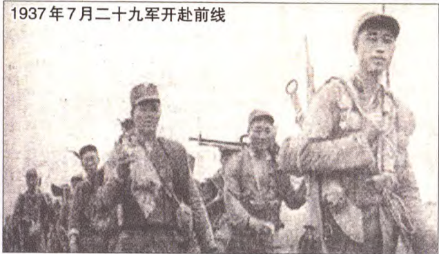
1937年7月二十九军开赴前线