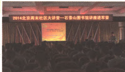
周末社区大讲堂进军营

“生态、生命、生活”讲座等,近三年来共举办专题讲座20余场次,受益官兵万余人次。