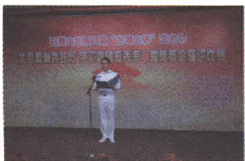
爱岗敬业演讲比赛(部队专场)

下一步,石景山区图书馆将继续围绕我区高端绿色发展战略,深入扎实开展双拥工作,不断创新服务形式,拓宽服务内容,延伸服务范围,与共建部队团结协作、相互促进、共谋发展,巩固图书馆在双拥工作中取得的成绩,努力将双拥工作推向更高的水平,为构建高端普惠的文化生活体系作出更大的贡献。