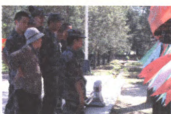
灯谜竞猜进装备部大院社区