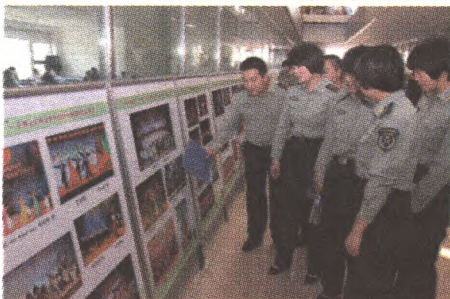
部队官兵来馆参观展览