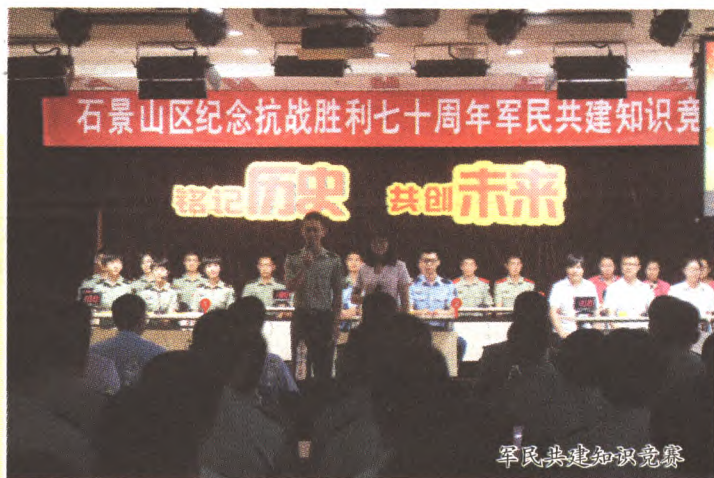
军民共建知识竞赛

区图书馆及时配合党的中心工作和部队重点、重点工作,举办图书展、图片展、剪报展、知识讲座、演讲比赛、座谈会、知识竞赛和联欢会等活动。为了让更多的部队官兵聆听到高品质的讲座,图书馆将特色活动品牌“名家讲坛”和“周末社区大讲堂”送进部队,开展专题讲座。邀请中国人民大学信息与资源管理学院刘耿生教授走进驻区某部队,进行“真实的潜伏——中共北平地下党和中共创建人在北京”专题讲座;邀请中共北京市委党史研究室副主任陆兵,先后两次到驻区部队,为官兵们讲述“中共党史中的智慧与启迪”;邀请中国科学院老科学家科普演讲团成员、北京麋鹿苑博物馆副馆长郭耕为驻区某部队官兵开展