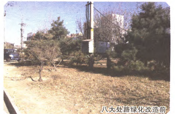
八大处路绿化改造前