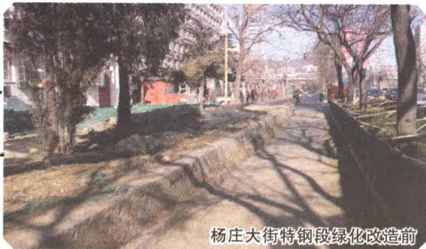
杨庄大街特钢段绿化改造前