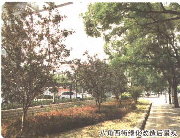
八角西街绿化改造后景观