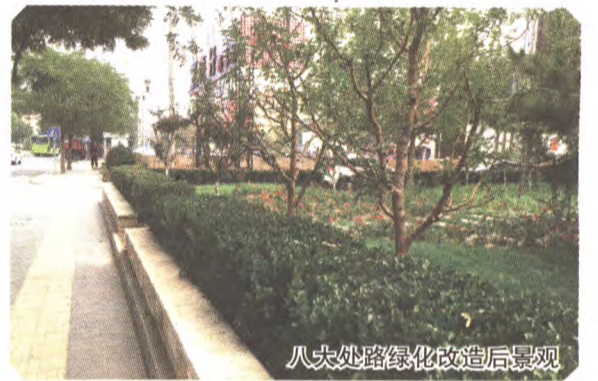
八大处路绿化改造后景观