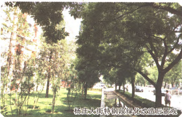
杨庄大街特钢段绿化改造后景观