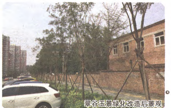
翠谷玉景绿化改造后景观