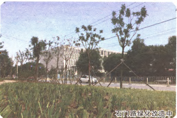
石门路绿化改造中