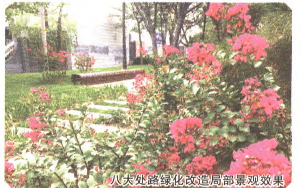
八大处路绿化改造局部景观效果