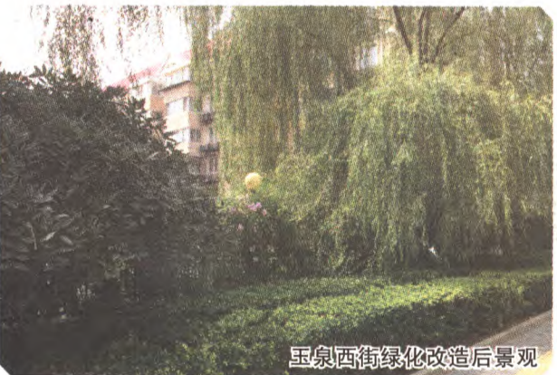
玉泉西街绿化改造后景观