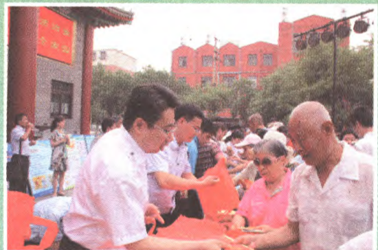
安全生产月咨询日宣传活动