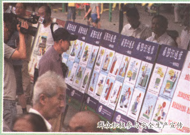
群众积极参与安全生产宣传

查 580 余家,查出并整改各类安全生产隐患近 2000 项,开展应急演练 68 次,开展各类知识竞赛活动 12 次,组织培训 48 次,培训受众人员近 4 万人。