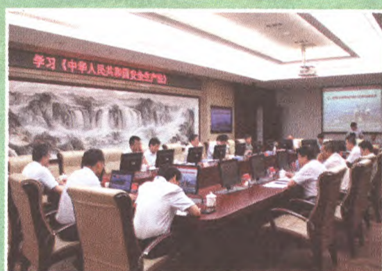
政府常务会会前学习安全生产法