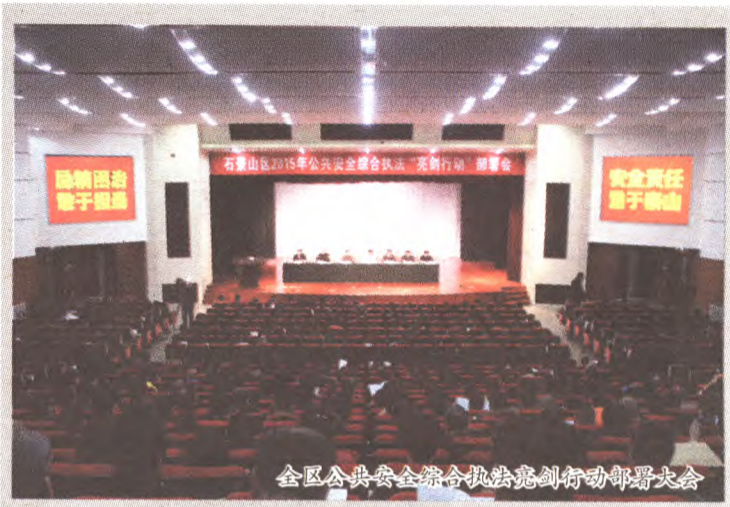
全区公共安全综合执法亮剑行动部署大会

以“加强依法治安,建设安全家园”为主题,扎实开展第十四个“安全生产月”活动,分四个阶段开展了政策咨询、知识竞赛、演讲比赛、隐患排查、专项执法、应急演练等活动。6月16日,区安监局在八角文化广场开展安全月咨询日活动,把整个活动推向高潮。各街道也根据实际情况,设立宣传“一条街”。“安全生产月”活动中,全区 62 家安委会成员单位召开 68 次不同形式的动员部署会议,参加活动人员近十万余人,参与活动的单位千余家,张贴各种宣传画近 3 万余张,悬挂横幅、标语等 3 千余幅,利用沿街 LED 大型广告宣传 48 处,发放各种宣传材料 10 万余份;设置专栏、板报等宣传园地近 800 余个,设置专题(栏)50 余块。发行内部刊物 18 个,参加活动人数近 6 万人,执法检