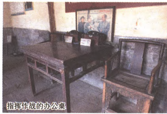
指挥作战的办公桌