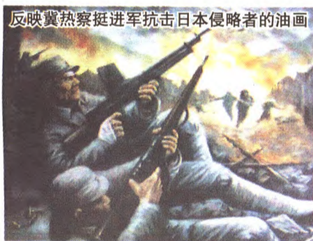
反映冀热察挺进军抗击日本侵略者的油画