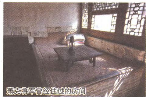
萧克将军曾经住过的房间