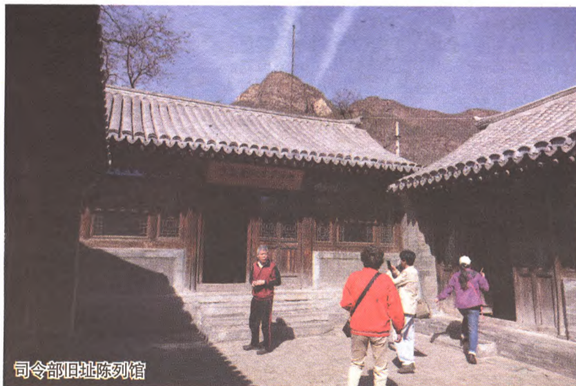
司令部旧址陈列馆