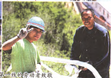
向奋战在电力施工第一线的劳动者致敬