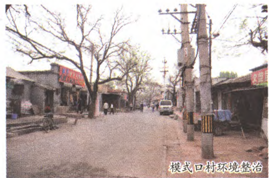
模式口村环境整治