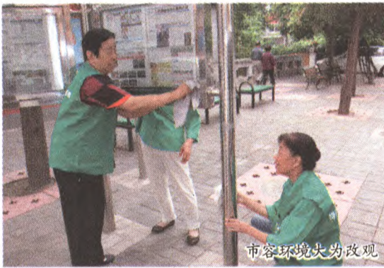
市容环境大为改观

强化协同共治,发挥区环境建设委员会、街道社会工委和地区管委会作用,调动驻区单位参与城市管理工作。以政府主导、社会参与方式,实施社会公厕、垃圾处理、垃圾分类、老旧小区环境卫生精细化管理等工作。会同首钢、北京军区等单位推进老旧小区环境整治,整合区内协管员队伍,实施分级分类、统一管理。建立居民议事会、文明劝导队等,促进社区自治管理。