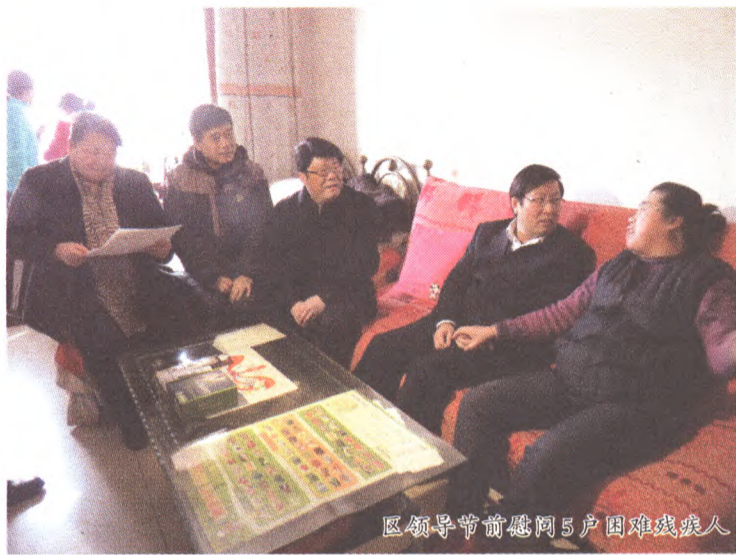
区领导节前慰问5户困难残疾人

2015年的两节,石景山区的困难残疾人感受到了春风的温暖、春雨的滋润,过了一个温馨的节日。石景山区残疾人工作者把党和政府的关怀、社会各界的关爱实实在在地送到了他们的心坎上。