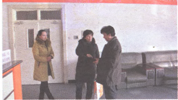
认真执行消防安全“四个能力”，安全防火人人有责