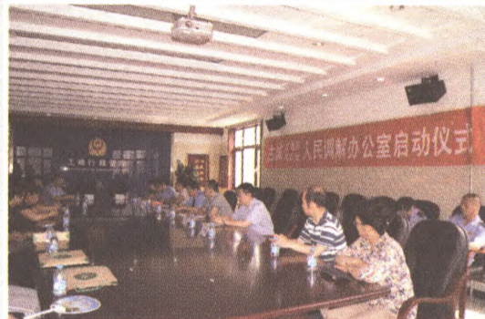
成立古城消费纠纷人民调解办公室