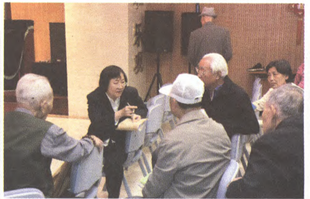
全面开展在职党员进社区送服务活动

紧紧围绕高端社会治理体系建设,不断强化人民调解第一道防线,扎实开展矛盾纠纷化解工作。从组织、队伍、场所、业务、纪律、保障等方面深入开展规范化调委会创建活动。加强人民调解员队伍建设,组织开展调解骨干培训、卷宗评查、知识竞赛、调解能手争创等活动,提升调解员预防和化解矛盾纠纷能力。强化多元调解联动机制建设,巩固和完善治安民间联合调解、人民调解进立案庭、道路交通事故纠纷调解、劳动争议调解等工作,新建消费纠纷调解委员会及古城调解办公室,拓展人民调解工作领域,形成多元调解合力。充分发挥人民调解工作的预防、调处和宣传作用,坚持日常排查和重点时期滚动式排查,积极服务房屋征收、拆违、群租房治理、亮剑行动等重点工作。全年各级人民调解组织共调解矛盾纠纷7529件,涉案金额达956.6万元。