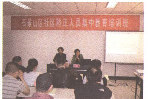
对社区矫正人员开展教育培训

2014年,在区委、区政府的正确领导下,区司法局深入学习贯彻党的十八届三中、四中全会精神,认真开展党的群众路线教育实践活动,