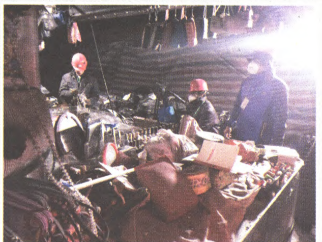
为“10.11”火灾提供公证服务