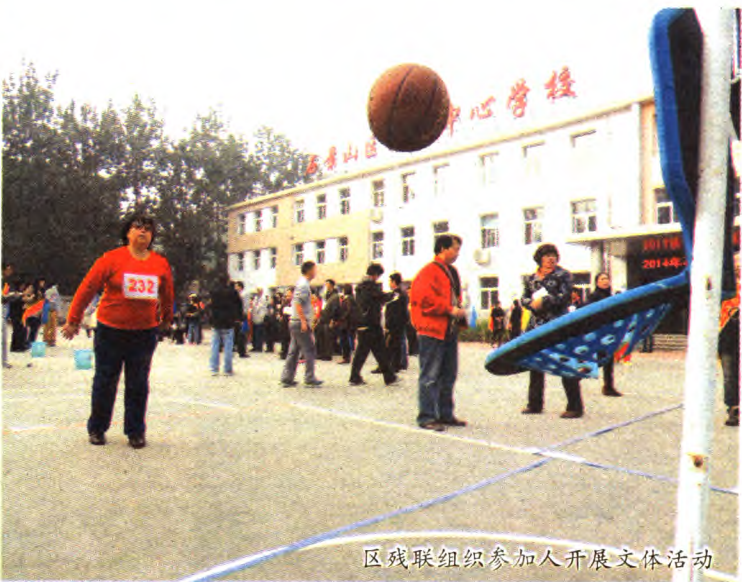
区残联组织参加人开展文体活动