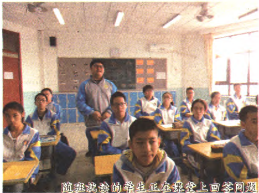
随班就读的学生正在课堂上回答问题

在我区21所中学里,共有41名残疾青少年,在老师的“激励”和“唤醒”下,孜孜不倦地投入中学的学习生活,在知识的海洋中吸取营养,在老师慈母般的关爱下,与健康的中学生一起享受着爱的阳光雨露。